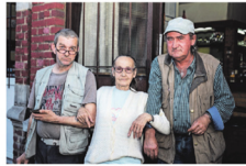
Dij café Fontanella, een van de laatste Belgische cafés in de wijk.