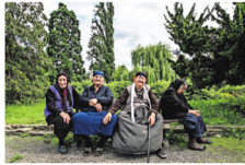
Vrouwen uit Turkije en Noord Irak in het park.