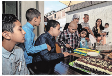
Marokkaanse familie tijdens het Offerfeest.