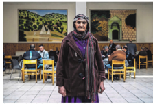
Gemeenschapshuis van de Vesdi's in Bressoux.